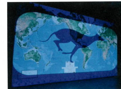
Nalini Malani