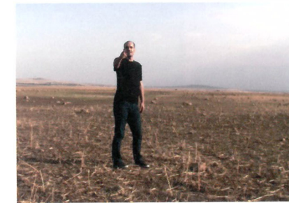
Sener Ozmen

〈미래가 끝났을 때〉는 사회의 일방적인 시선이 지금의 젊은 세대를 규정짓는 현상에 대해 문제의식을 느끼고, 정치, 경제, 사회, 문화적으로 시대적 감수성을 공유하는 11명(팀)의 작가가 참여하는 전시이다. 정보산업 기술은 지속적인 발전을 이루고 있는 반면, 모두가 삶에 대한 불안정성을 꺼내고 무한 경쟁 사회에서 살아남기 위해 몸부림 치고 있다. 이러한 현실을 살아가고 있는 작가들은 그들의 개인적 경험에서 비롯된 동시에 사회적 공감대를 형성 할만한 소재로 작업하며 자신들의 세대에 대해 이야기하고 있다.